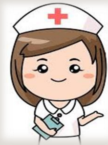
ณัฐธยาน์